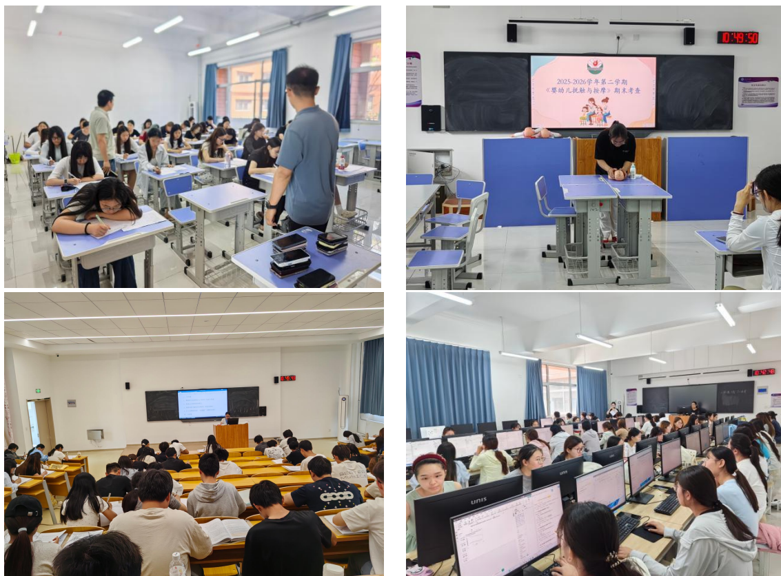
2026年6月22日-6月26日听课巡课照片

巡考过程中，各考场学生均能按时入场、安静就座，答题专注认真，展现出良好的考风学风。公共课与专业课考场纪律保持一致，未出现交头接耳、左顾右盼等异常情况，反映出本学期学风建设的积极成效。