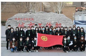
中共中央华北局城市工 作部红色教育团日活动