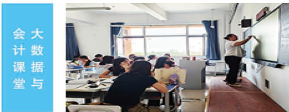
大数据与会计课堂