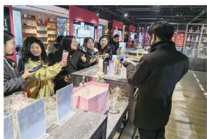
学生到河间工艺玻璃产业带开展调研

职业面向： 可胜任市场营销员等工作，可胜任销售代表、销售经理、卖场经理、小微商业企业创业者、市场主管、市场经理等工作岗位，此外，还可以从事互联网营销师等相关工作。