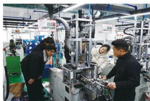
学生到服饰配件企业生产车间开展产品调研