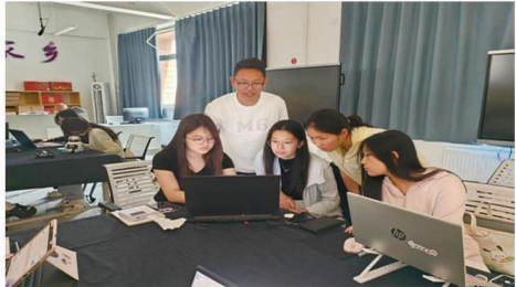
企业高 管给电 商 项目班 学生授 课