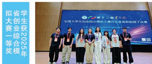
学生获2025年省创业综合模拟大赛一等奖