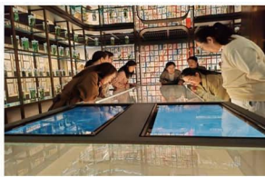
师生走进“沧州燕赵 名医馆”