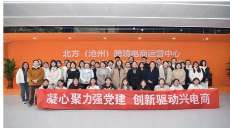
基商北 地运方 营一 中心沧 州实 训电