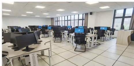
大数据与会计实训室

职业面向： 毕业生可就业于企事业单位的出纳、稽核、往来结算会计、成本会计、总账会计、会计电算化岗位；会计中介服务业的审计助理、代理记账岗、税务筹划岗位等。