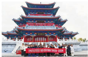
师生走进“沧州南川楼”