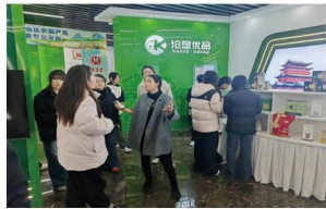
师生走进“沧州沧农 农产品展览馆”