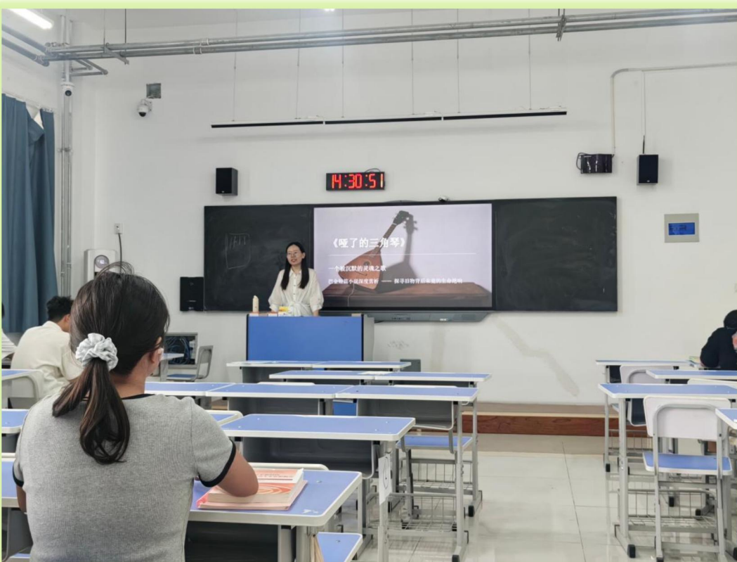
2026年6月15日-6月18日听课巡课照片