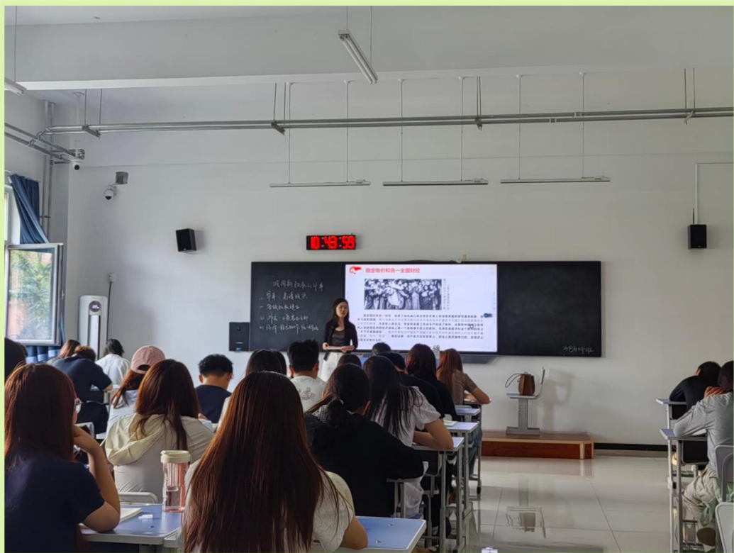
2026年6月8日-6月12日听课巡课照片