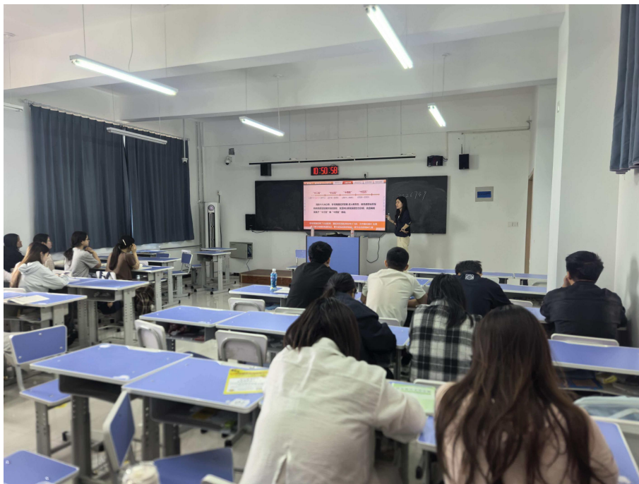
2026年4月27日-5月15日听课巡课照片