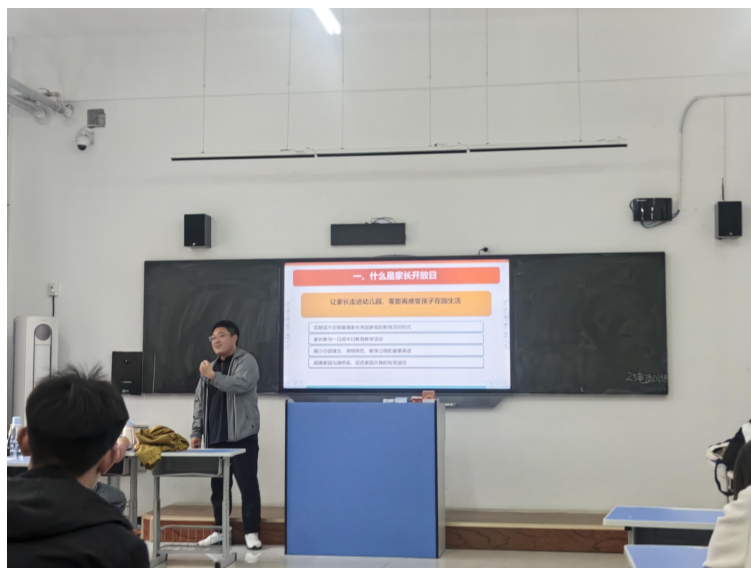
2026. 4. 13-2026. 4. 17 听课、巡课照片