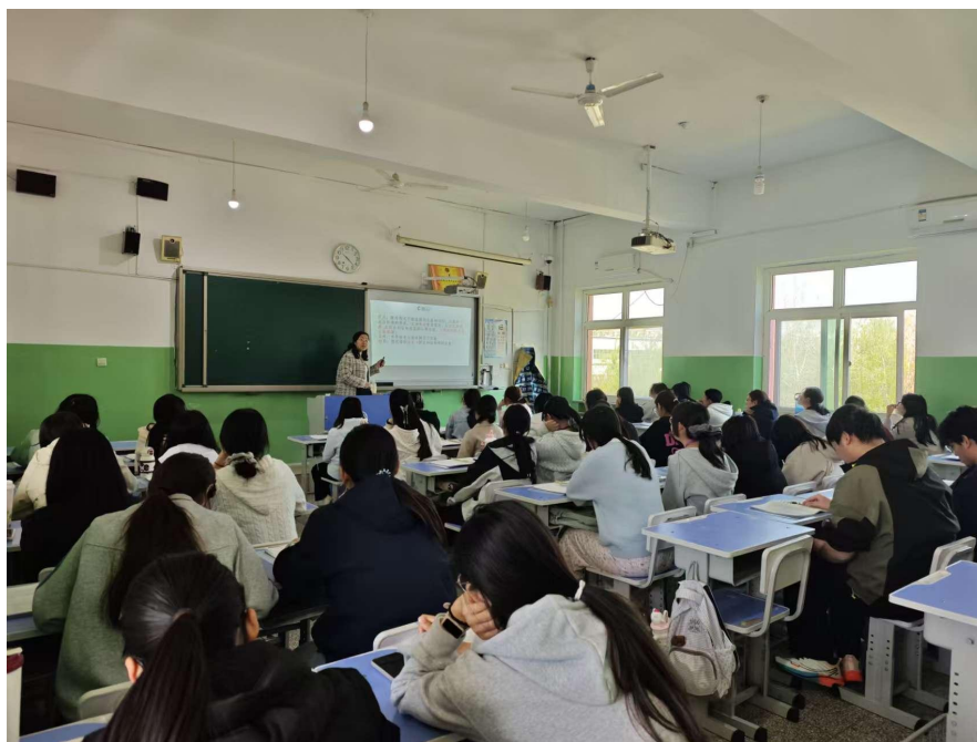
2026. 4. 7-2026. 4. 10 听课、巡课照片