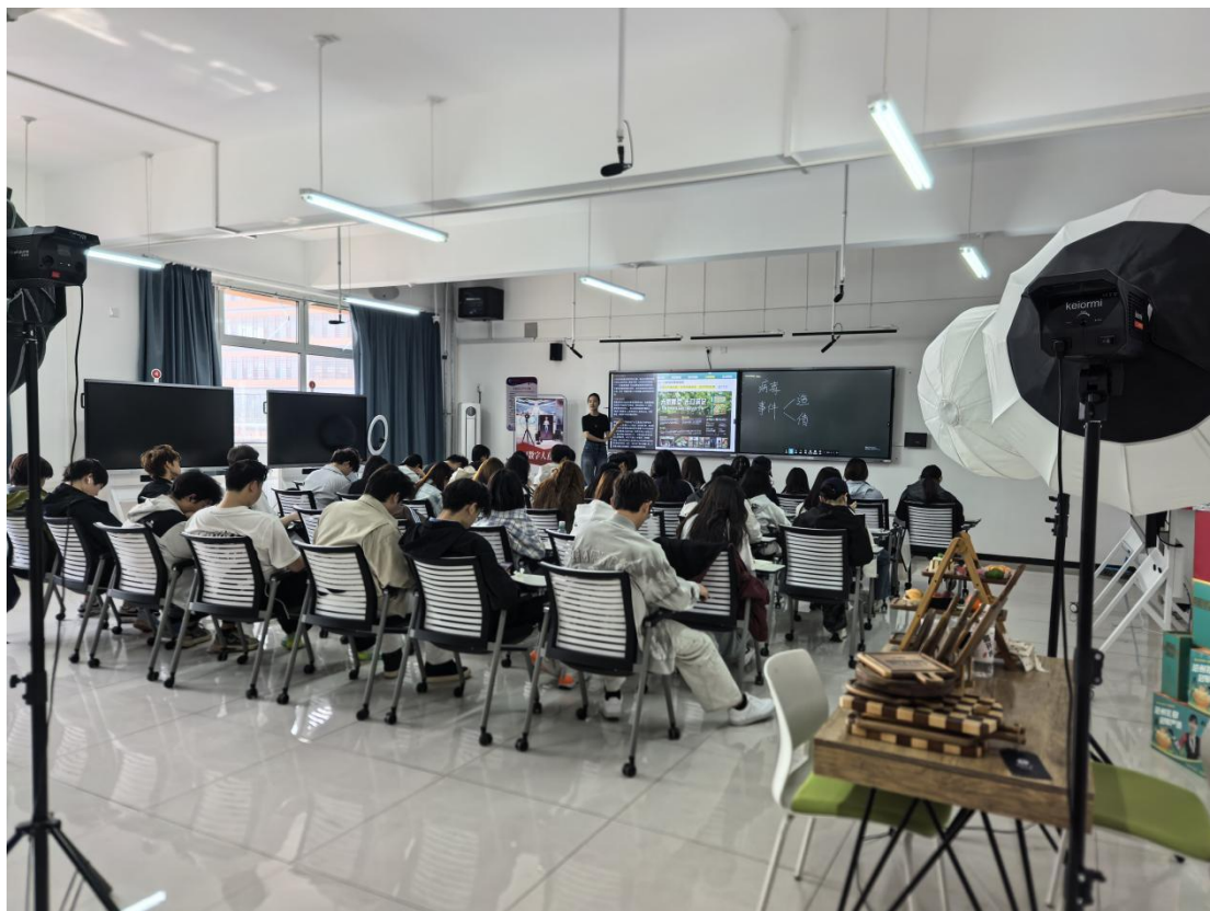
2026. 3. 23-2026. 3. 27 听课、巡课照片