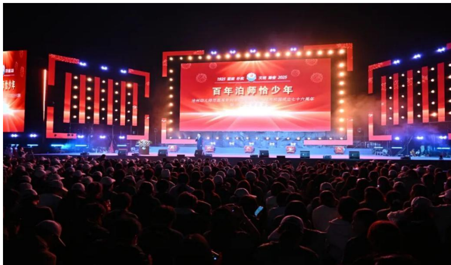
图 3-17 迎新晚会现场

化浸润。它强化了新生的归属感与认同感，展现了学校以文化人、以美育人的办学理念，也为百年学府在新时代传承文脉、启航新征程营造了隆重而温暖的集体记忆。