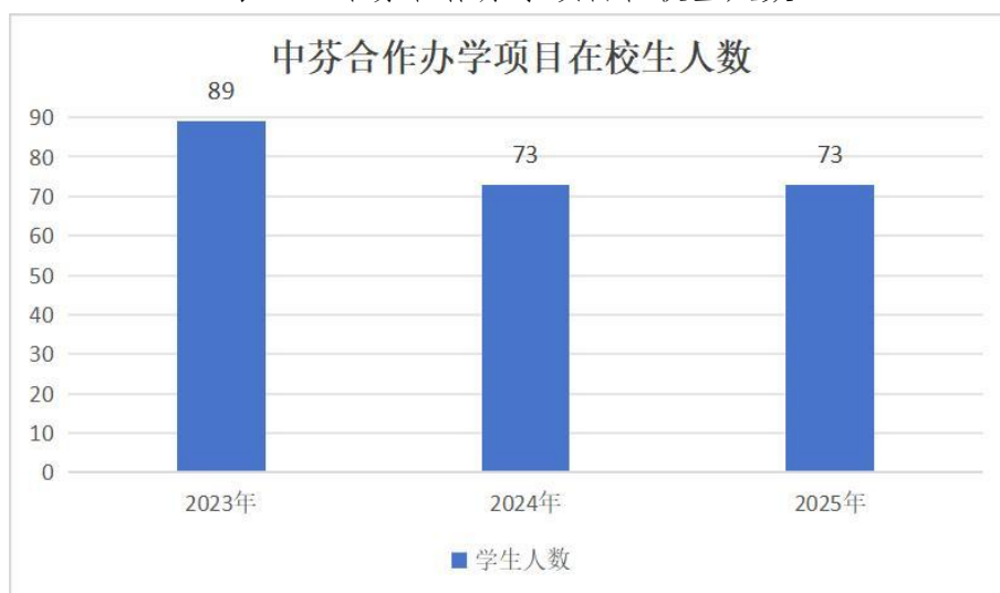
表 4-1 中芬合作办学项目在校生人数

学校与芬兰罗约阿应用科学大学的合作项目已步入第三届学生培养的成熟期。2025 年，中芬合作办学项目在校生总数 235 人（见表 4-1）。