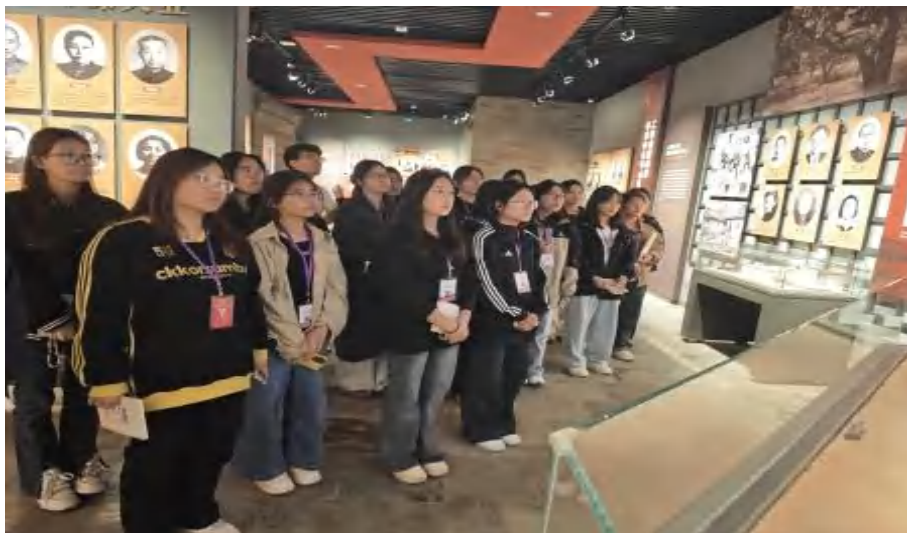
图 3-1 参观中共中央华北局城市工作部泊头旧址

的革命精神，引导学生主动学习先烈故事、分享感悟体会，坚定以先烈为榜样，锤炼过硬本领、奋进青春征程的信念。同时，组织师生赴烈士陵园开展主题教育活动，师生整齐列队向革命烈士敬献花圈、肃立默哀，深切缅怀先烈丰功伟绩（见图 3-2，图 3-3）；重温入团誓词，铮铮誓言彰显新时代青年传承先烈遗志、勇担时代使命的决心；同步开展烈士墓祭扫、革命丰碑瞻仰及纪念馆参观活动，详细学习青沧战役等革命历史，在历史图片与实物展品前，深刻体会革命胜利的来之不易，进一步筑牢红色信仰。