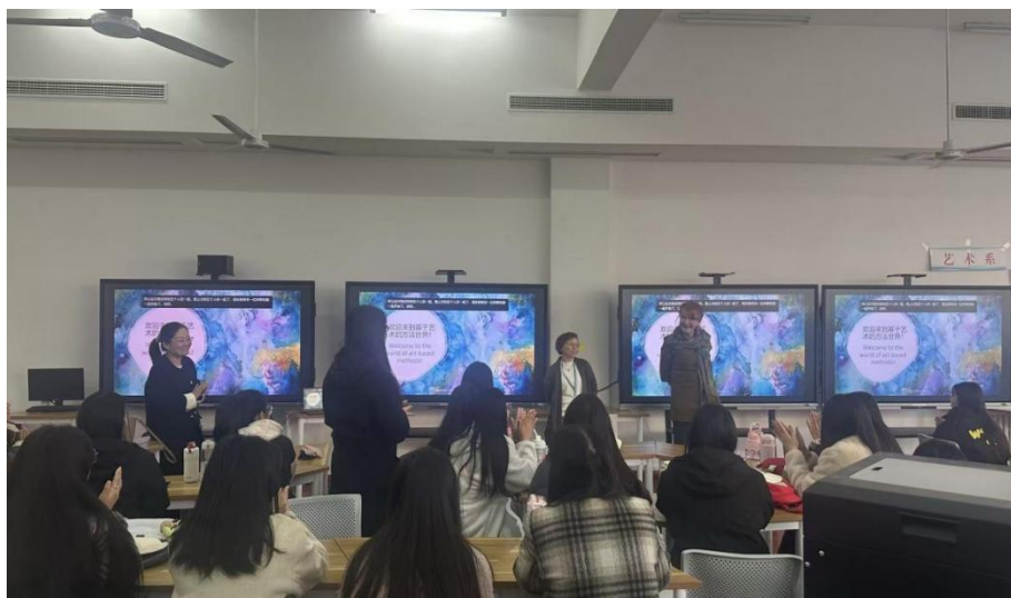
图 4-1 辅导员参与外教授课

经过一学年实践，学生在外教课程中表现显著提升。数据显示，学生与外教日常交流的流利程度提高了 18.5%，使用英语进行专业讨论的能力提升 16%。未来，该辅导员将继续完善支持机制，拓展文化体验活动，并积极引入国际优质课程资源，进一步深化中外合作育人成效，助力培养具有国际视野的专业人才。