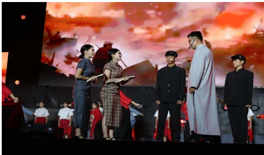
图 3-18 舞台剧《百年星火，运河长歌》