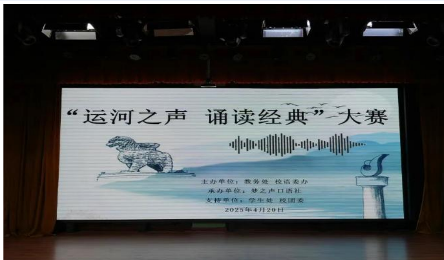
图 3-9 朗诵大赛泊头校区赛场

此次大赛作为学校深化语言文字教育的生动实践，如同一粒火种，点燃了师生对经典的探索热忱。这场跨越时空的对话，不仅让文化自信厚植于心，更激励全体师生以传承为笔、以创新为墨，在弘扬中华优秀传统文化的长卷上书写担当，为绘就社会主义文化强国的时代蓝图增添澎湃的青春注脚。