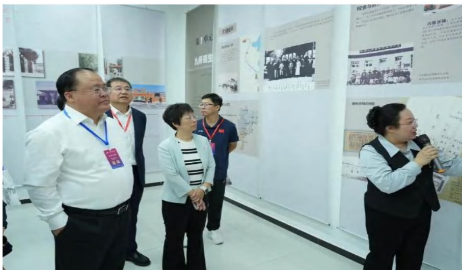
图 3-15 与会领导参观校史展

展览现场墨彩交织，观众驻足品鉴，在艺术与历史的对话中，深切感受学校“以美育人、以文化人”的使命。百年正芳华，学校将继续推动美育创新，为沧州文化强市建设贡献沧幼力量。