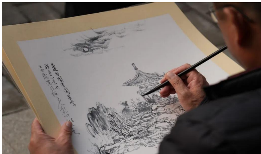
图 3-14 行走的美育课——南川楼写生

强化美育内涵建设，固化育人成果。组织校内外专家力量，编写并出版了《新时代大学生美育》教材，为美育课程的系统化、科学化提供了重要支撑。目前，学校已初步形成了以美育必修课和选修课为主体，以丰富的艺术实践活动和浓郁的校园文化环境为两翼的“课堂教学+实践活动+校园文化”三位一体的“大美育”工作格局，美育的育人功能得到显著增强。