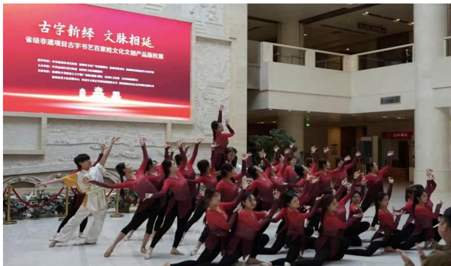
图 3-11 非遗项目版权展现场舞蹈《仓颉造字》

流动的“文化风景线”，助力观众深层次读懂非遗艺术的独特价值与传承意义（见图 3-11）。