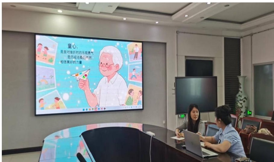
图 3-19 “AI 绘音·美育润心”短视频创作

纽带，打破学科壁垒，深度融合美术创意与音乐表达，引导师生以短视频为载体，发现生活中的艺术之美、传递校园里的文化温度。此次校园文化活动，不仅丰富了师生课余文化生活，更有效提升了师生跨学科综合素养与数字艺术创作能力，推动科技与美育在校园文化中的深度融合，同步积累了一批优质数字化美育教学资源，为校园文化创新发展、美育育人模式优化升级注入鲜活动力，助力营造兼具科技感与人文气息的校园文化氛围。