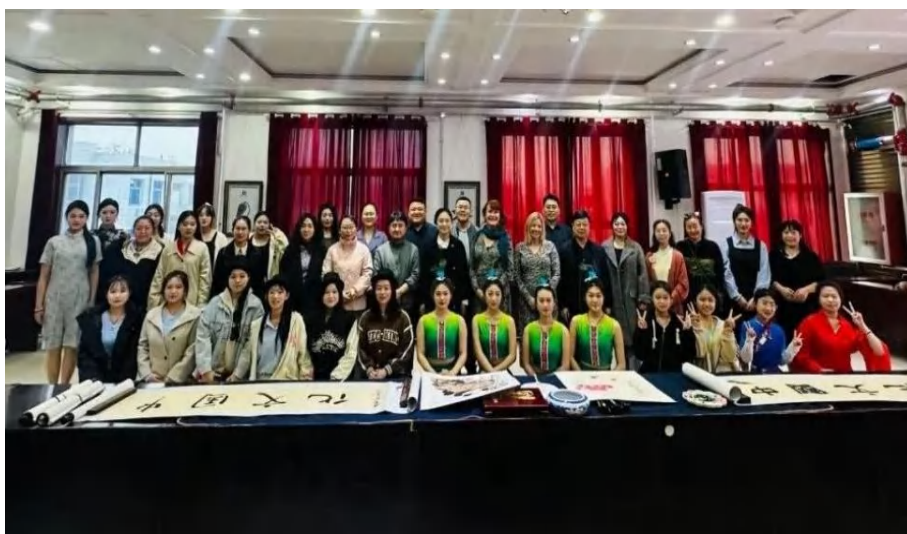
图 4-3 活动交流现场合影

2025年3月26日举办的“多元文化·共融共生”中芬文化交流活动，是一次精心设计、沉浸式文化体验的成功范例。活动（见图4-3）超越了简单的文艺表演，构建了一个多层次的文化对话空间。节目《春晓》舞出古典诗韵，《茉莉花》《声声慢》唱响东方韵律，古筝与竹笛奏响传统与现代的共鸣。特别是原创节目《童趣诗舞》，将古诗与手势舞创新结合，赋予了传统文化鲜活的现代表达力，收获了中外师生的热烈欢迎。在文化体验区，书法、绘画、魔术等互动环节，让两位芬兰教师从“旁观者”变为“参与者”，亲手提笔书写汉字、体验水墨趣味，在互动中深刻感知中国文化的智慧与魅力（见图4-4）。