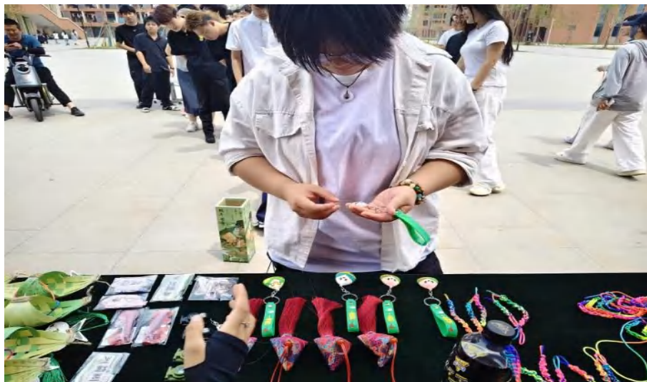
图 3-8 学生制作香囊

粽情满春华，古韵润校园。学校组织“粽情满春华”端午文化主题党日活动，活动以“粽叶传古韵”为核心，精心设置包粽、猜谜、编五彩绳、制香囊、投壶等趣味互动环节，将端午传统民俗与沉浸式体验深度融合，让师生在亲身参与中感受中华优秀传统文化的独特魅力，推动端午文化浸润校园，进一步厚植校园文化底蕴，丰富校园文化生活（见图 3-8）。