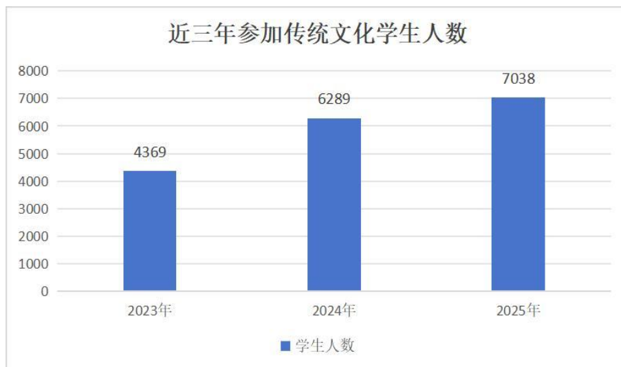
表 3-2 近三年参加传统文化活动学生人数