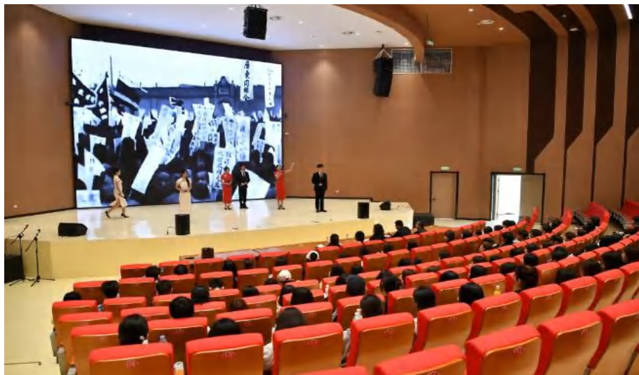
图 3-10 朗诵大赛沧州校区赛场