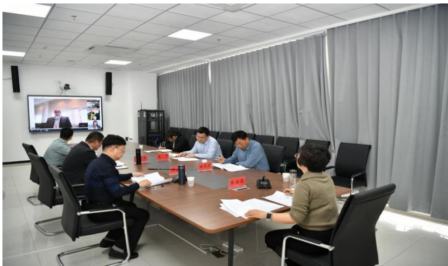
图 4-2 中芬两校线上交流会

面对国内生源结构变化与学前教育行业调整的宏观形势，学校以发展的眼光对中芬项目进行了审慎评估。经过与芬方友好、坦诚的协商（图 4-2），双方共同决定在现行协议期满后，将合作方式进行转型升级。将合作重点从单一的学历教育项目，转向更灵活的师资培训、联合科研、课程开发等领域，为双方在未来构建更高层次、更多样化的伙伴关系预留了战略空间，体现了学校优化国际教育资源配置的前瞻性，是学校国际合作从“规模扩张”向“内涵与效益优先”转变的关键一步。