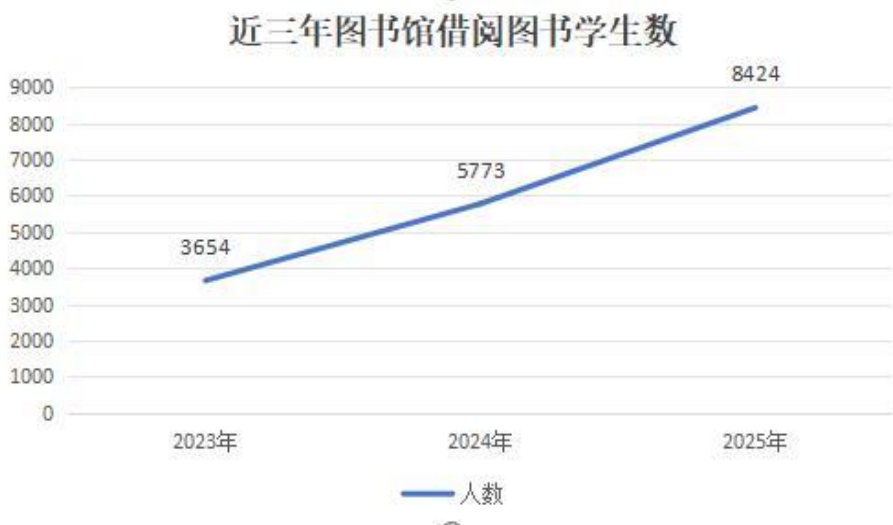
表 3-3 近三年图书馆借阅图书学生数