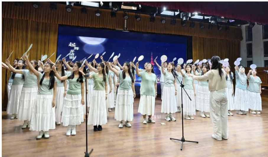
图 3-4 “山河诗韵颂国心”合唱比赛

开展“奋进新时代 红韵诵中华”朗读“心”境界比赛，活动以舞蹈表演开篇营造温情氛围，参赛选手依次登台，通过红色爱国经典作品演绎，或缅怀先烈或礼赞祖国或诠释青年担当，以真挚情感传递红色力量，现场氛围热烈，赢得全场阵阵掌声。此次比赛不仅为学生搭建了风采展示平台，更以红色经典诵读为载体厚植师生爱国情感，后续学校将持续搭建各类文化育人平台，让红色声音响彻校园，激励青年学子奋进新时代（见图 3-5）。