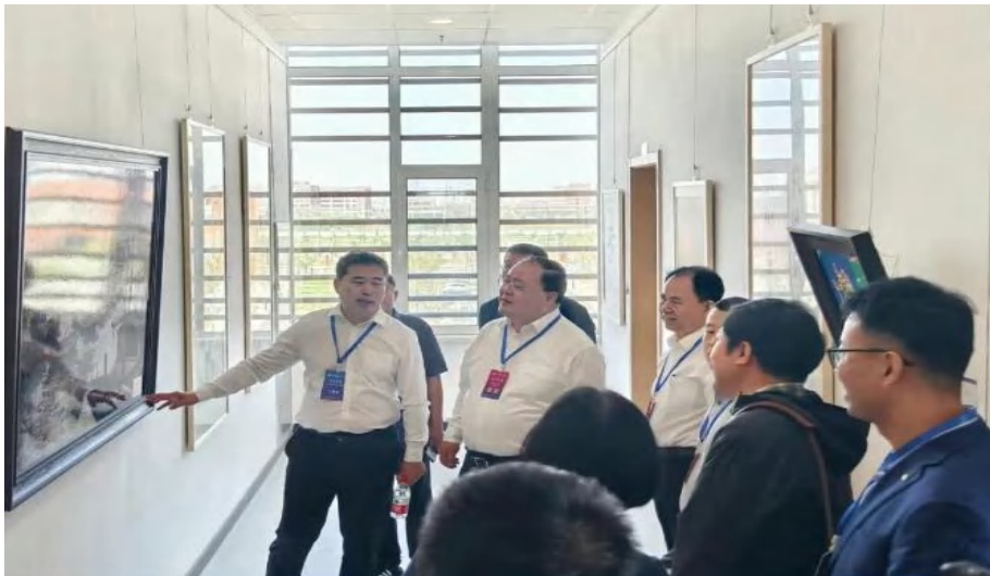
图 3-16 与会领导参观画展