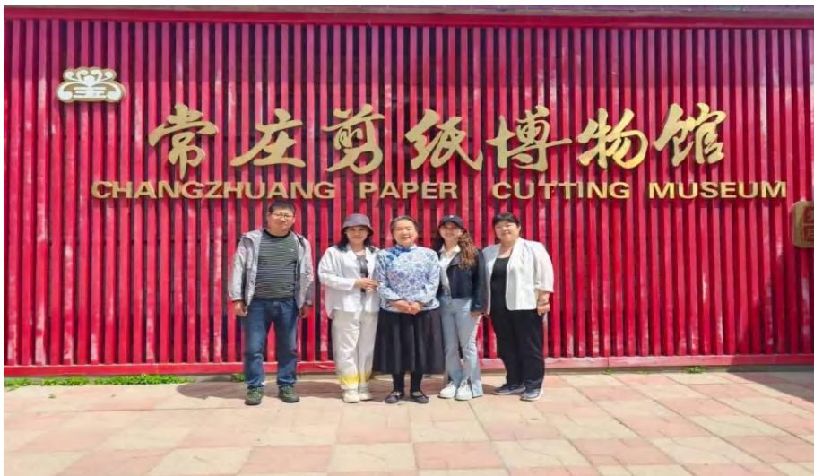
图 3-13 老师们前往黄骅市常庄非遗剪纸博物馆参观学习