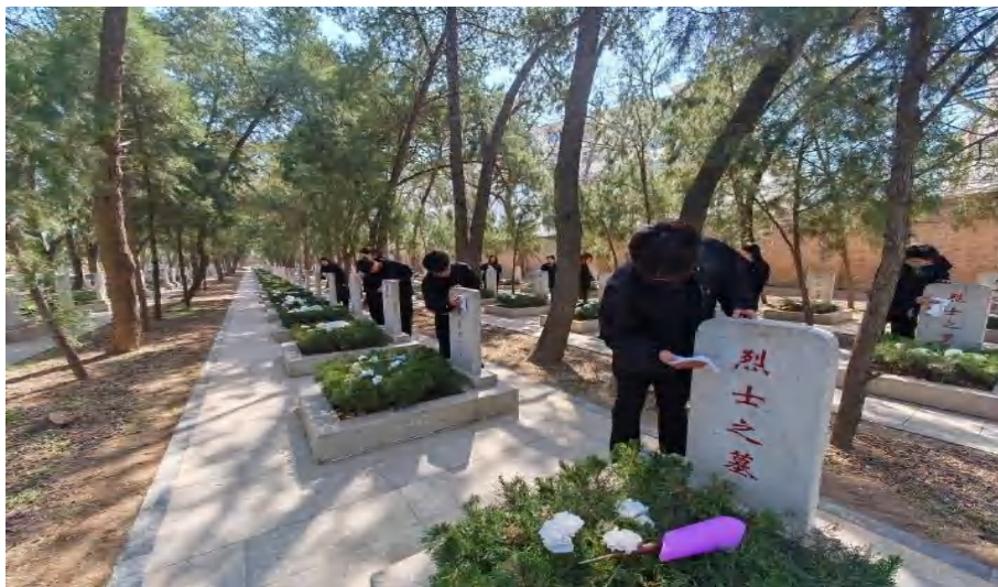
图 3-3 学生祭扫烈士墓