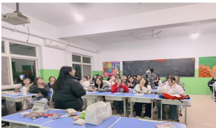
图 3-6 《弟子规》晚读活动

为推动中华优秀传统文化跨文化传播，搭建中西文化沟通桥梁，学校举办中华传统节日英文故事大赛，鼓励学生以流畅英文讲述春节、端午、中秋等传统节日的起源传说与民俗风情（见图 3-7）。活动中，学生既充分展现扎实的英语表达能力，又生动传播中华文化的精髓与内涵，在备赛、参赛过程中深化对传统节日文化的理解认知，同步提升跨文化交流能力，助力中华优秀传统文化走向更广阔的舞台，进一步增强全校师生的文化自信与文化传播能力。