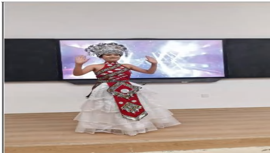
图 3-12 “世纪薪传·霓裳雅韵”青年大学生风采秀