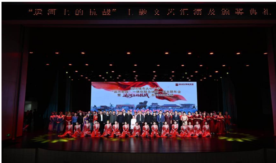
图 1-7 文艺汇演现场

作为本届年会的承办单位及联合体秘书处单位，学校全程参与并助力了该平台从2024年北京市级联合体到2025年八省市联合体的跨越式发展。学校不仅推荐多项师生文艺作品与教学案例在年会中获奖，更以此为载体，积极探索“以美育人、以文化人”的校本实践路径，为“运河思政”一体化建设提供了扎实的实践支撑与区域样本，是学校深化“大思政”育人格局、凝聚协同育人合力的重要体现。