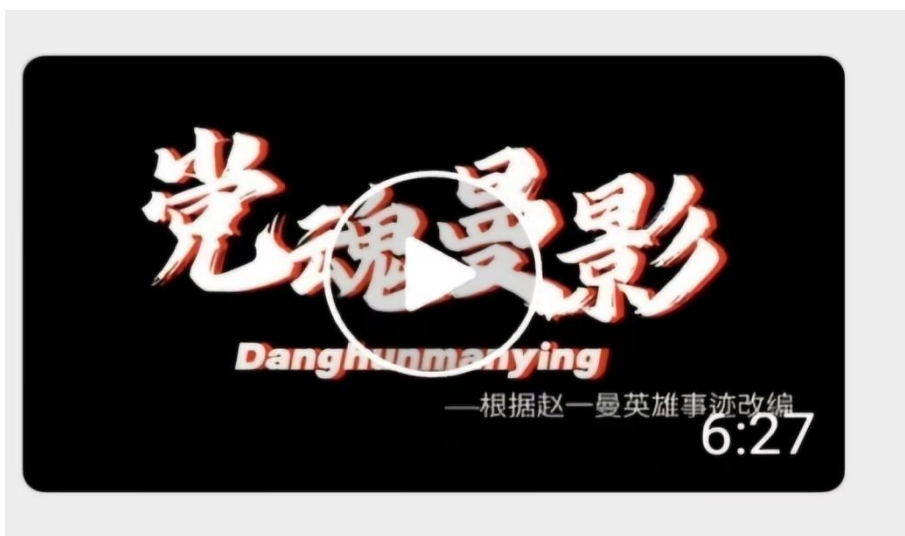
图 1-9 学生创作微电影

针对高职学生“实践型”学习特质，创新实践教学形式，开展“大学生讲思政课之‘百年校史我来说’”“一周行一善”“微电影拍摄”等活动，让学生从“被动听”变为“主动讲、亲身做”，强化理论理解与情感认同，全年学生制作思政微电影50余部（见图1-9）；学校还组织了学生前往大运河非遗馆、黄骅盐碱地开展实地研学，通过参观展览、聆听行业故事、近距离观察实践场景，将爱国主义教育、生态文明教育融入实践，让思政课“走出课堂、走进生活”，全年开展实践教学32学时，覆盖2000余人。