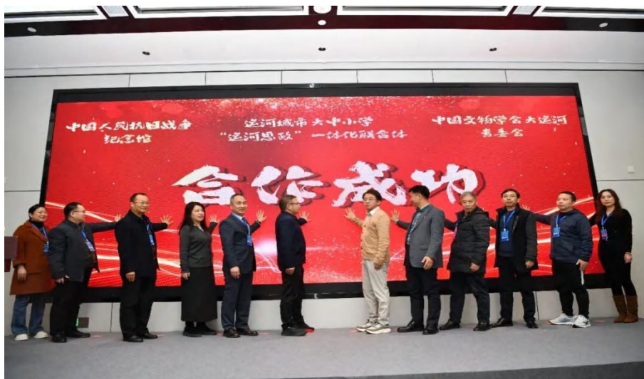
图 1-5 合作备忘录签署现场

年会上，联合体与中国人民抗日战争纪念馆、中国文物学会大运河专业委员会等权威机构签署合作备忘录，将共识转化为机制化、常态化的协同行动，标志着“运河思政”协同育人体系进入实质推进、持续深化的新周期（见图 1-5）。