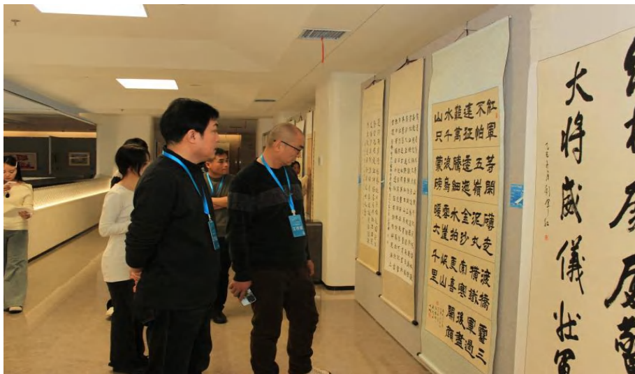
图 1-6 年会书画展现场

摄影作品近 600 件，文艺汇演节目近 100 个。其中“运河上的抗战”主题书画摄影展作为本次年会的重要组成部分，于 12 月 12 日起在大运河非遗馆正式对外开放，并精选展出沿线八省市作品 200 余幅。充分体现了运河城市大中小学“运河思政”一体化联合体的凝聚力与创造力（见图 1-6）。