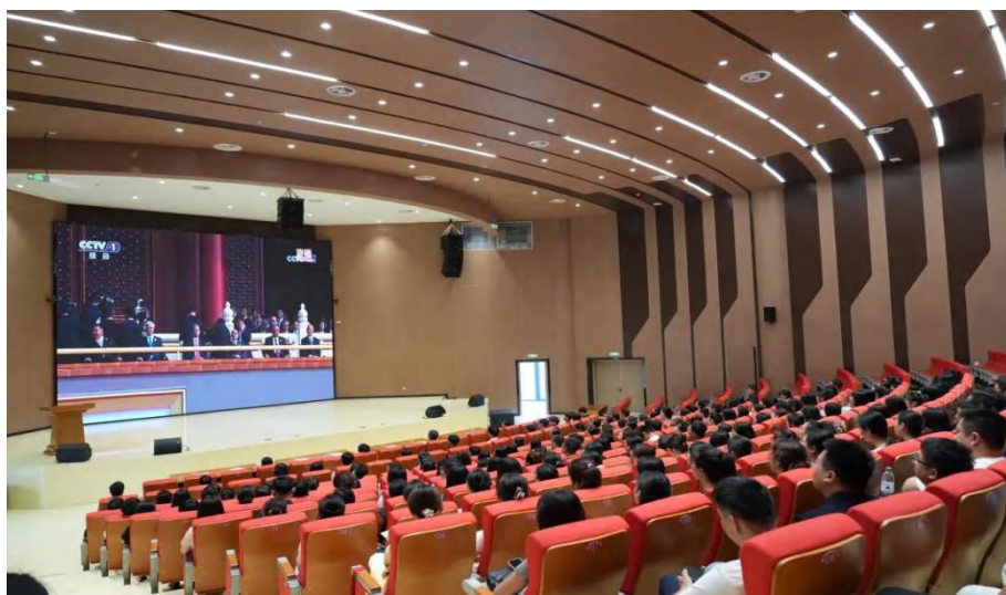
图 1-8 师生共同观看九三阅兵活动

阅兵式结束后，马克思主义学院教师尹莹朝带大家一起走进本次活动的第二个环节——思政微课堂。尹老师以娓娓动听的讲述，阐释了九三阅兵的深远意义，结合阅兵仪式上的高光时刻，带大家一同回顾了抗日战争的风雨历程，感受祖国从往昔到今朝的繁荣巨变，探讨如何让抗战精神照亮新的奋斗征程。她指出，这次主题教育活动不仅是对历史的铭记、对英雄的致敬，更是对和平的珍爱、对未来的开创。