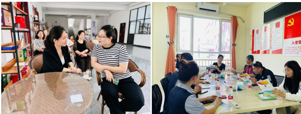
图 3.高校-幼儿园联合教研活动