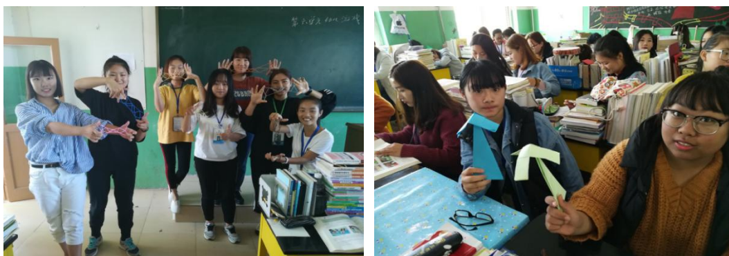
图 8.幼师民间游戏实训教学

该成果研发的“民间游戏”“雕花陶球泥塑”“乡土文化”“二十四节气”等特色课程资源已全面融入沧州幼专学前教育专业人才培养体系，开设《民间游戏设计与指导》《雕花陶球泥塑教学》等特色课程，推动项目化教学与案例教学改革。学生通过真实项目实训和岗位实践，课程开发与创新实施能力显著增强，近三届毕业生用人单位满意度达 96%以上，有效破解了高职学前教育人才培养同质化、与实践脱节的问题。