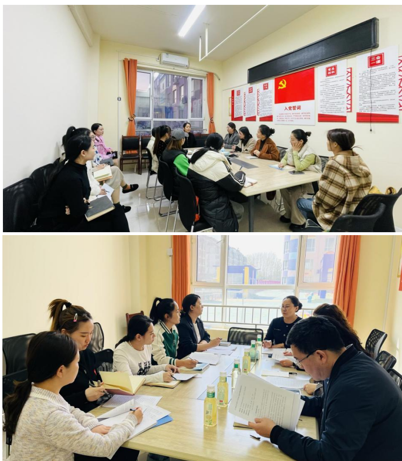
图 2.园校开展课题共研