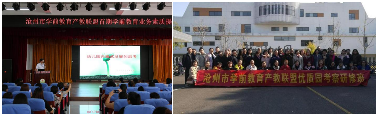
图 6.沧州市学前教育产教联盟培训访学活动