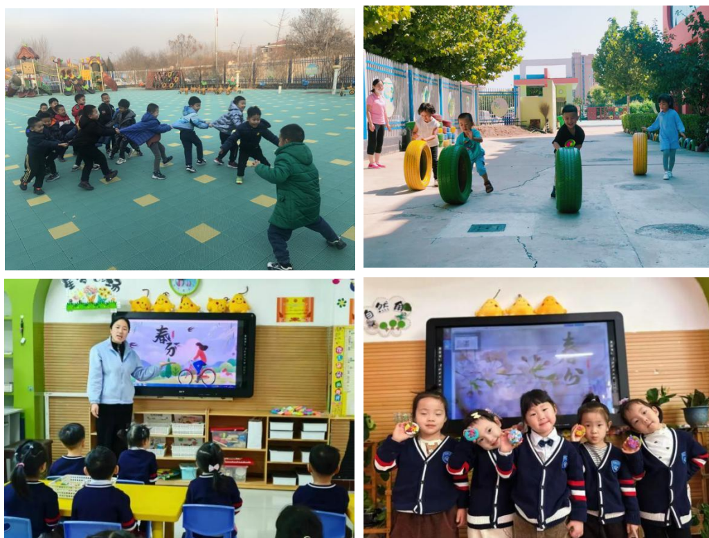
图 9.联盟内幼儿园开展特色课程教学

本项目所构建的“双环共育、四维联动”机制已推广至河北省内 23 家幼儿园，被多家教育机构采纳为园校合作范本。该机制为区域学前教育协同发展提供了可操作、可复制的实践模型，推动了更多地区开展基于地域文化的课程建设与师资共育合作。