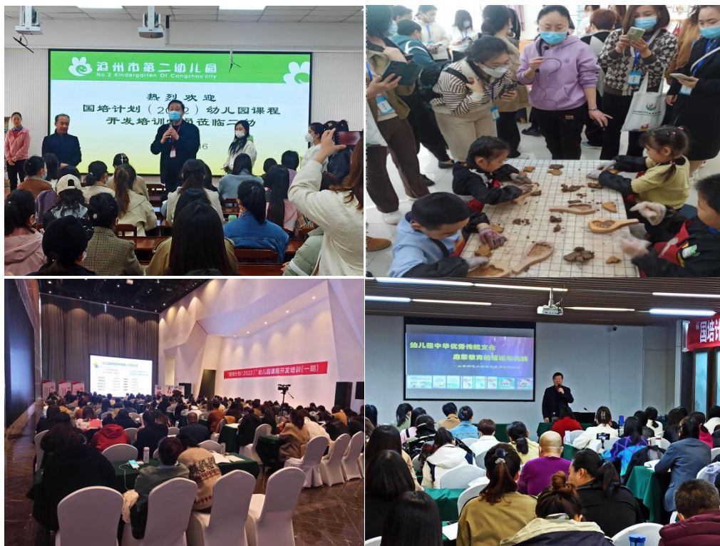
图 10.在 2023 年河北省幼儿园骨干教师国培中做经验分享