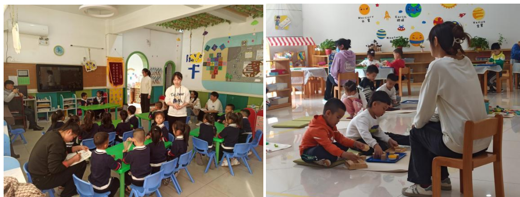
图 7.联盟园特色课程实践

师 420 余人、幼儿近 4000 名。通过“四维联动”机制，幼儿园教师的课程开发与实施能力得到实质性增强，合作园所已初步形成“一园一品”的课程特色与发展格局。