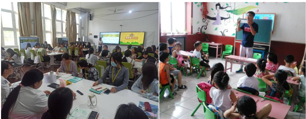
图 4.岗位互聘，师资共用

全面推行“双导师制”与岗位互换机制。聘请了 8 名具有丰富实践经验和特色课程开发能力的一线幼儿教师担任高校学前教育专业的兼职教师，承担《游戏指导》《手工制作》等实践性课程教学；同时，高校每学期选派专业教师深入幼儿园担任课程顾问，全程参与园本课程开发与教学改进工作，共同打造了一支既懂理论又精通实践的“双师型”团队。