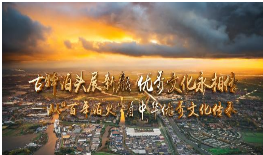
图 1-1 古驿泊头展新颜 优秀文化永相传