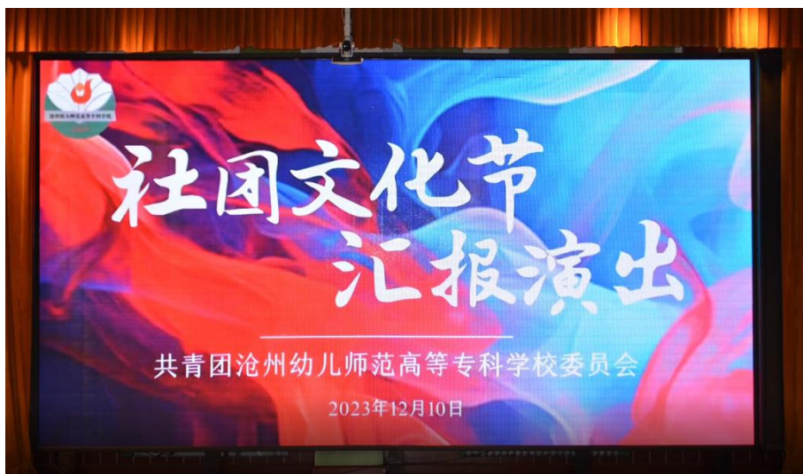
图 1-7 社团文化节演出现场

剧社的心理剧《预防诈骗 从我做起》通过情节生动的剧情演绎，提升了全场师生的防诈骗意识；九三音乐社原创音乐歌曲《我怀念的》唱出了对青春的赞歌；模特社带来的模特秀满足了现场观众的时尚审美；近3个小时的演出中，现场观众脸上始终洋溢着快乐的笑容，不时爆发出阵阵喝彩声和掌声。