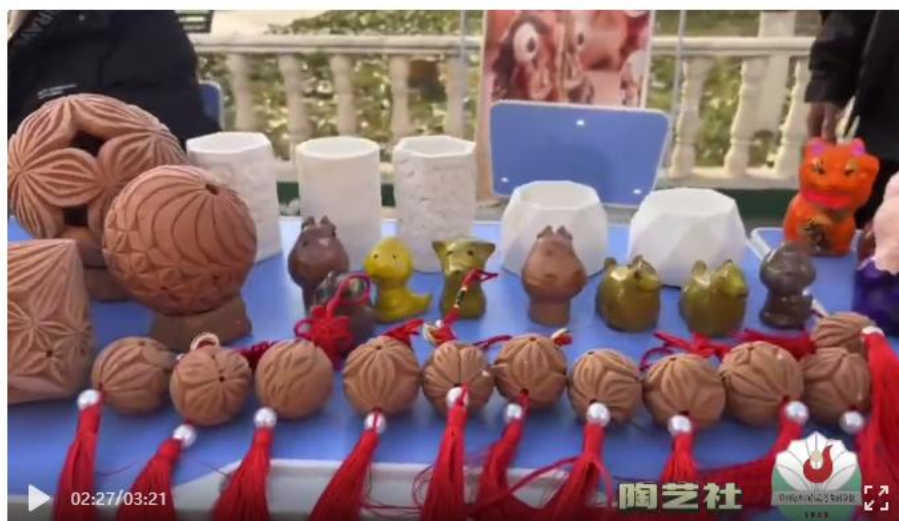
图 1-8 陶艺社展演