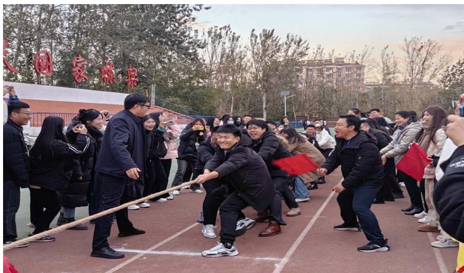
图 1-3 辅导员与学生共同参赛