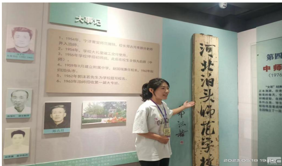
图 1-6 校史解说比赛现场