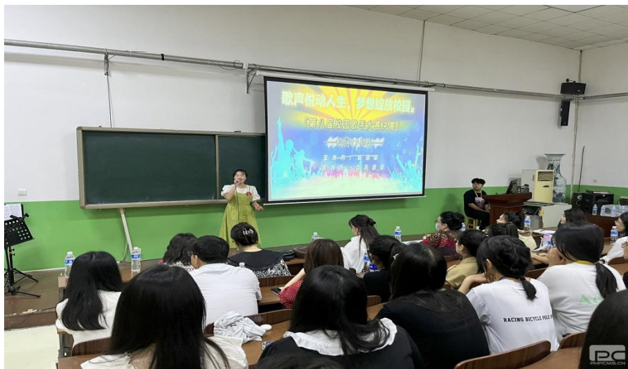
图 1-5 校园歌手大赛现场

学生社团每年均常态化开展多项学生社团活动，注重理论教育和实践活动相结合，丰富校园文化，提高学生综合素质。2023年5月，校团委举办了“好读书，读好书”主题演讲比赛，近三百名学生到场参与观看，通过演讲使学生感受到了读书的魅力；2023年6月，由校团委举办的“歌声悦动人生，梦想绽放校园”第八届校园歌手大赛，动听的音乐，青春的旋律响彻校园（见图1-5）；校史解说社于2023年6月举行第三届校史解说大赛决赛，为提高校史社成员的解说水平，加深了学生对学校百年历史的感受（见图1-6）；2023年6月学前教育系以三笔字课程教学为依托，秉持以训促学，以赛促课，以赛促训的教育理念，引导学生利用碎片化的时间，提升学生三笔字书写技能，并将学生优秀作品进行展示。2023年校团委于11月—12月举办了社团文化节，社团汇报演出精彩纷呈，各社团精心策划，积极备演，为观众们带来了一场精彩绝伦的演出。