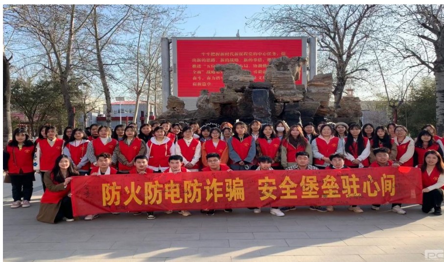
图 1-9 青年志愿者合影

按照共青团沧州市委关于开展“学雷锋月”志愿服务的工作部署，结合学校实际，3月1日，学校青年志愿者协会在明德楼前广场开展了以“防火防电防诈骗 安全堡垒驻心间”校园安全宣传志愿服务活动。有近300余学生参加，使同学们深入了解在校园生活中用电和用火的安全常识，同时提高防范网络诈骗的意识（见图1-9）。