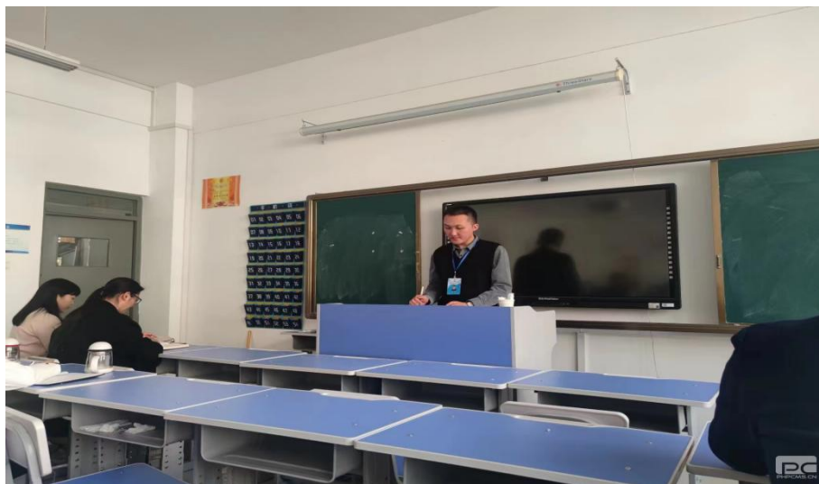
图 1-4 主题班会模拟现场

“大练兵”活动提供了一个相互学习取长补短的成长平台，积极营造出了学业务、练技能的浓厚氛围，使辅导员教师受益匪浅。