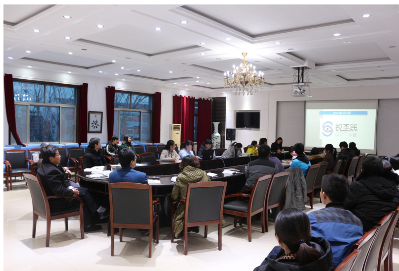
“双导师工作室”教学改革研讨会

工作较为容易上手，一定程度上可以减少企业人才的培养成本，提高企业的工作效率，为企业创造更多的利润，有助于企业的成长和发展。